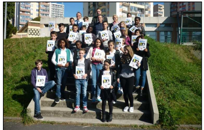
Remise des albums à la fin de l'année scolaire 2014-2015

Depuis 2 ans. Le projet ne dure que 3 ans.