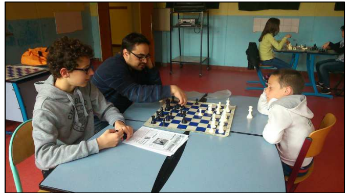
David et les joueurs d'échecs