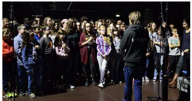
Enregistrement à La Carène pour le clip Imagine