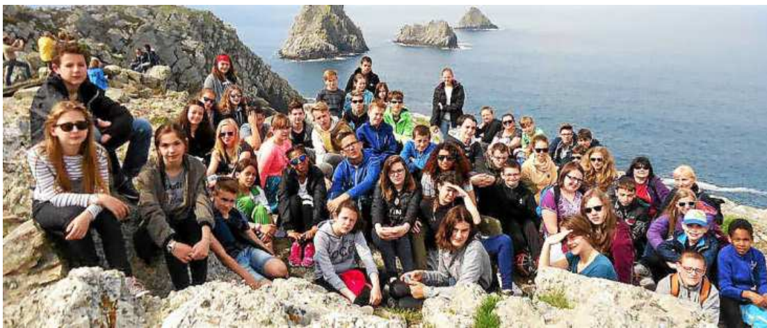
Photo du groupe à la pointe de Pénhir, publiée par Le Télégramme