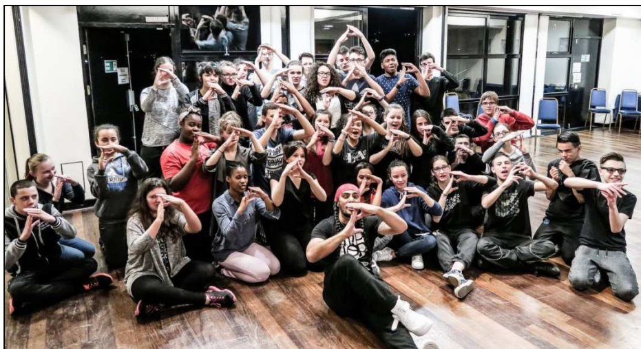
L'équipe lors du stage de hip-hop

Nous avons eu aussi une séance quartier libre – shopping et comme soirée : hip-hop et danse traditionnelle avec les Plymouth Morris Dancers.