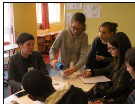
Quelques élèves « ambassadeurs » servaient du café aux intervenants.

Mme Hergouarch : Cette matinée se passe bien, on est très bien accueilli.