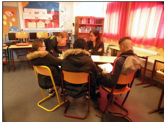
Rencontre avec des professionnels

Samedi 21 janvier avait lieu au collège le 1 er Carrefour des métiers. Particularité : tous les intervenants étaient d'anciens élèves de notre établissement. Nos reporters étaient présents et vous ramènent photos et interviews (suite page 2)