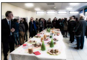
Les classes de 4 ème et de 3 ème SEGPA aux fourneaux.

Élève en section H.A.S (Hygiène Alimentation Service, un atelier de 4 ème et 3 ème SEGPA, j'ai préparé avec mes camarades un apéritif pour accueillir les invités.