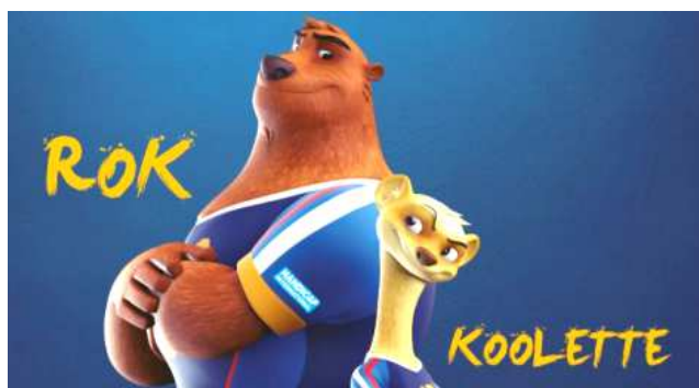
Les deux mascottes du Championnat.

Après les rencontres, nous avons eu la visite de Rok, la mascotte du Championnat du Monde de Handball .