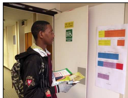
S'orienter vers son futur métier mérite réflexion

Après plus de deux heures d'échanges, professionnels et organisateurs du Carrefour des métiers se sont retrouvés autour d'une petite collation préparée et servie par les élèves de section HAS eux-mêmes. (voir ci-dessous)