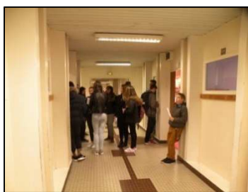
De salle en salle, à la rencontre du monde du travail

Quel changement constatez-vous dans l'établissement ?